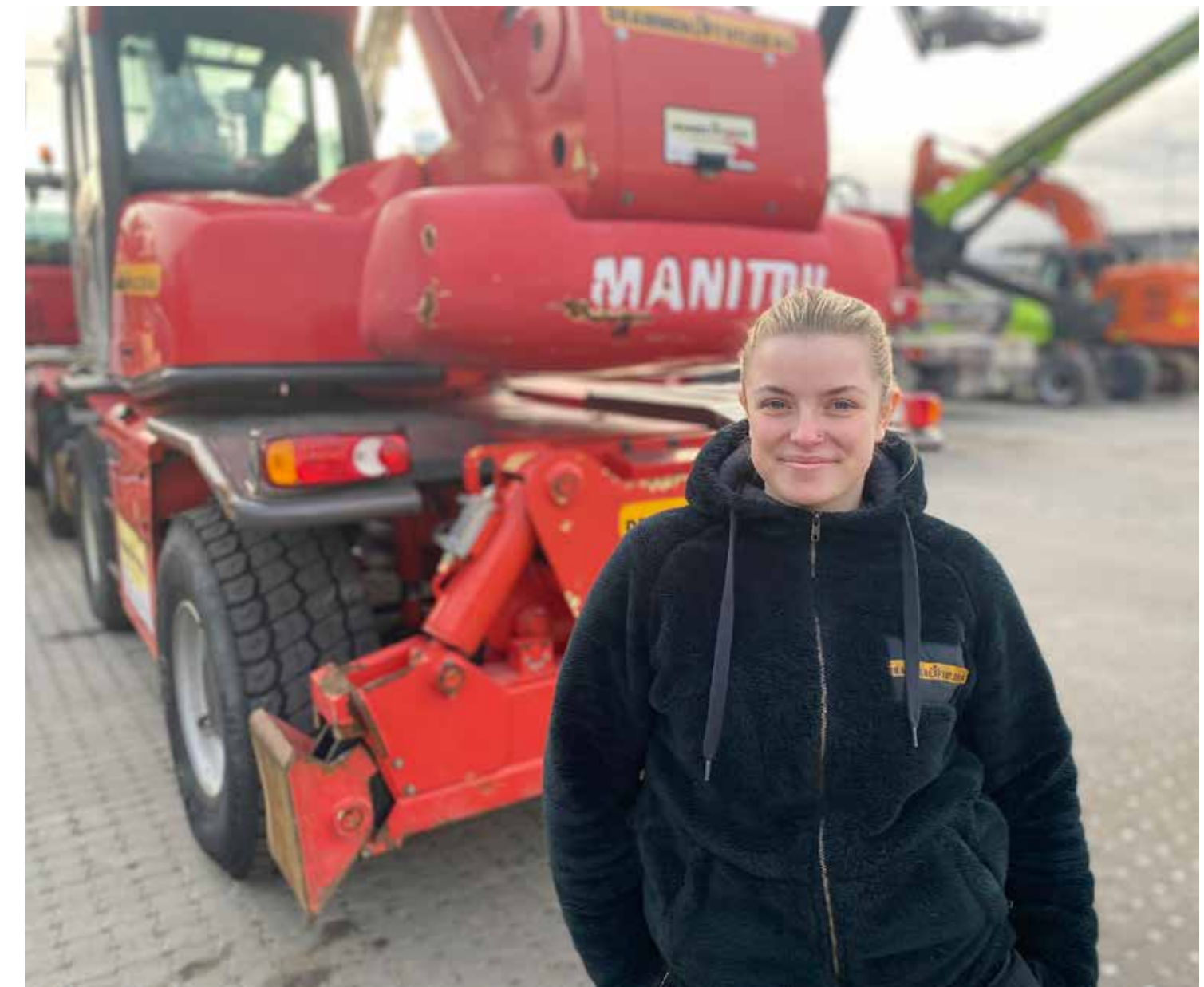
FAGBREV NUMMER TO: – Jeg har lekt med tanken på å ta fagbrev nummer to som truck og liftmekaniker. Det er i samme gate som det jeg driver med nå, men gir enda mer faglig kompetanse.